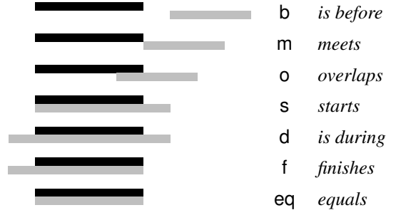
(a) Signification intuitive.

Les AQ en général sont définies ci-dessous par leurs syntaxes et leurs sémantiques. Finalement, des mécanismes d'inférences sont décrits.